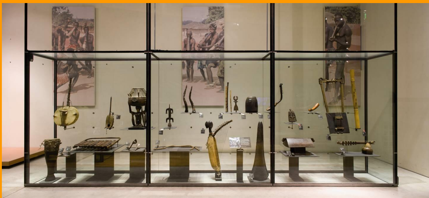
Vitrine Afrique © Nicolas Borel