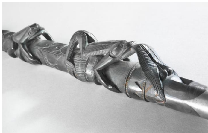
Flûte à conduit, anonyme, Iles de la Reine Charlotte, Canada, début 19ème, E.1219