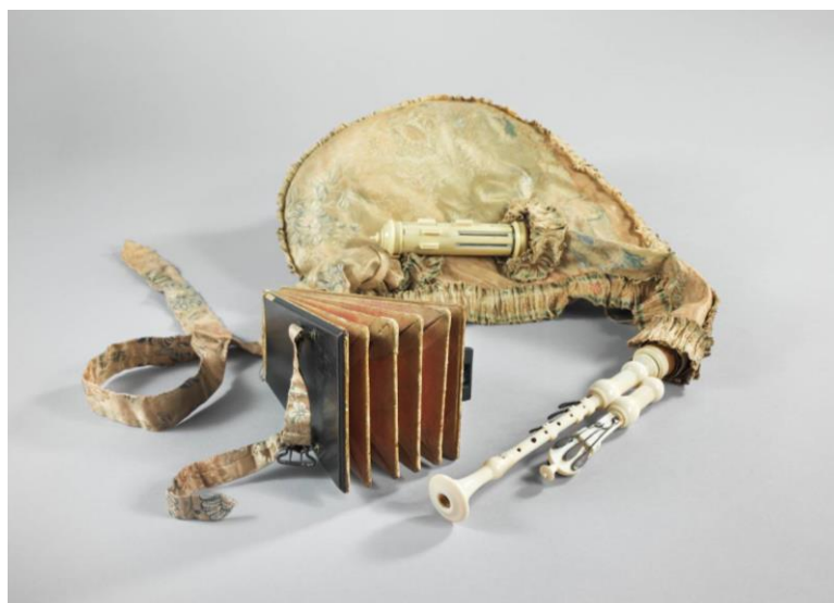
Musette de cour, Chédeville, Paris, début 18ème, E.571