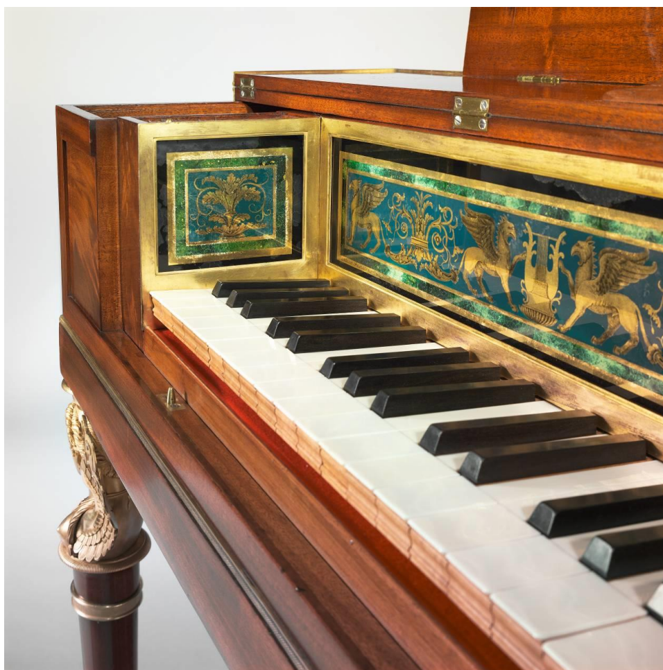
Piano carré, Erard frères, Paris, 1809, E.2001.5.1, vue de 3/4 face ouvert