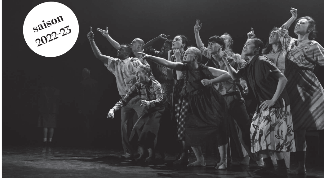
LICHT: Bach dances