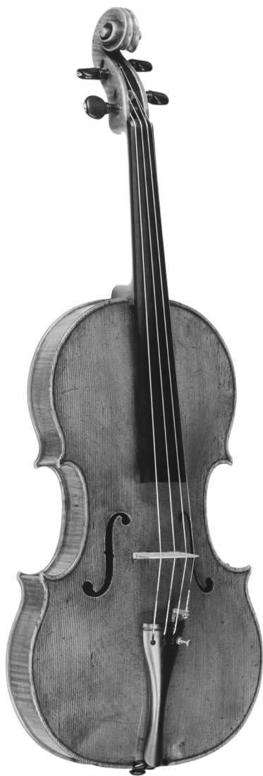
Alto « Stauffer » de Girolamo Amati, Crémone 1615 (Fondation Stauffer – exposé au Museo del Violino, Crémone)