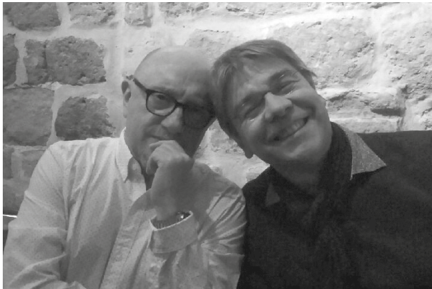
Michel Blanc avec Éric Tanguy