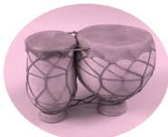
Paire de bongos, xx e , © Musée du Vieux Toulouse.