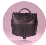
Cloche à vache, Musée de la musique.