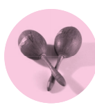
Maracas, xx e , États-Unis, Musée de la musique.