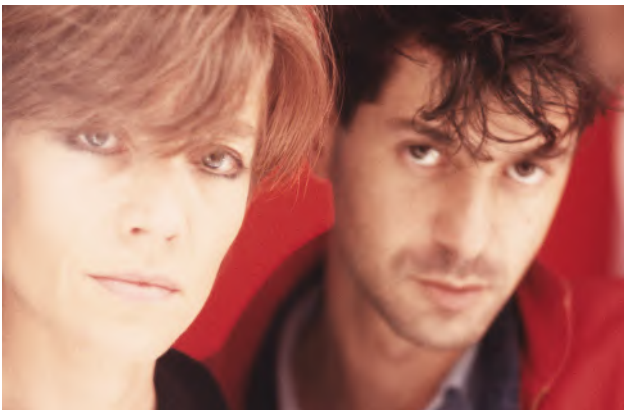
Françoise Hardy et Étienne Daho, 1985

L'ensemble de ces oeuvres est exposé au sein d'une scénographie innovante et radicale signée Freaks Architecture, jeu de miroirs et d'entrelacements, s'appuyant sur une synchronisation rythmée entre images et sons.