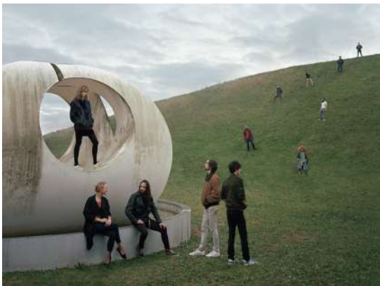
Catastrophe, 2016

200 portraits illustrent et font revivre 4 grandes périodes entre 1950 et aujourd'hui, à travers l'objectif de grandes signatures et des témoins de l'époque.