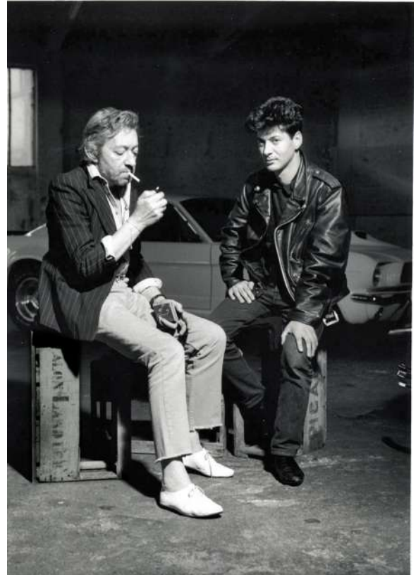
Serge Gainsbourg et Étienne Daho, 1987